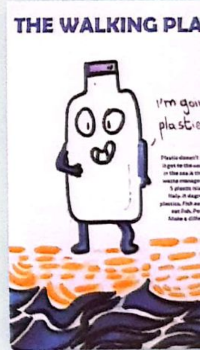
2A SCUOLA SECONDARIA DI I GRADO Michelangelo Augusto di Napoli, "THE WALKING PLASTIC"