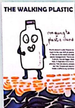
2A SCUOLA SECONDARIA DI I GRADO Michelangelo- Augusto di Napoli, "THE WALKING PLASTIC"