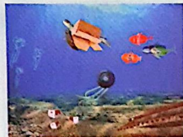
3C SCUOLA SECONDARIA DI I GRADO ICS Don Piero Pointinger di La Valletta Brianza (LC), "MARE DI RIFIUTI"