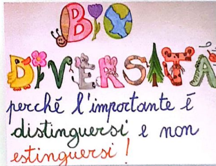
1A SCUOLA PRIMARIA Norma Cossetto di Abetone Cutigliano (PT), "L'IMPORTANTE È DISTINGUERSI E NON ESTINGUERSI"