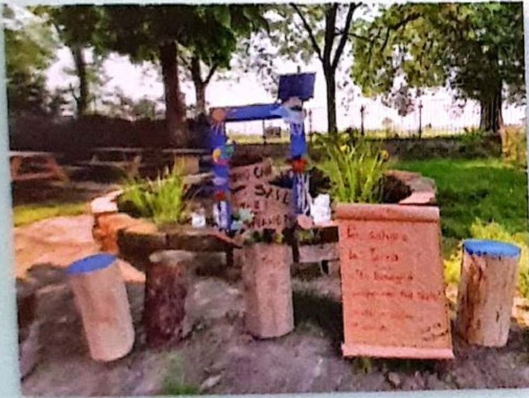
5B SCUOLA PRIMARIA San Biagio di Codogno (LO) "CORNICI DA SELFIE" PER L'AMBIENTE

Si sono meritati una menzione d'onore (vuol dire che hanno meritato tantissimo anche se non sono stati scelti come vincitori!):