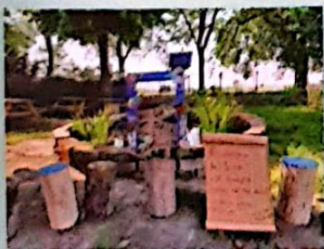
5B SCUOLA PRIMARIA San Biagio di Codogno (LO) "CORNICE DA SELFIE" PER L'AMBIENTE

Si sono meritati una menzione d'onore (vuol dire che hanno meritato tantissimo anche se non sono stati scelti come vincitori!):