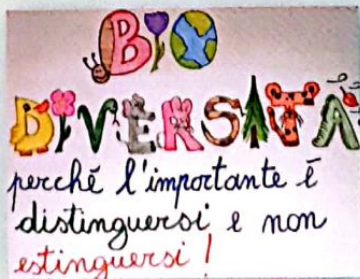
1A SCUOLA PRIMARIA Norma Cossetto di Abetone Cutigliano (PT), "L'IMPORTANTE È DISTINGUERSI E NON ESTINGUERSI"